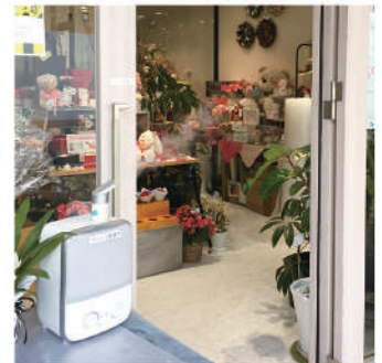
店舗入り口での除菌