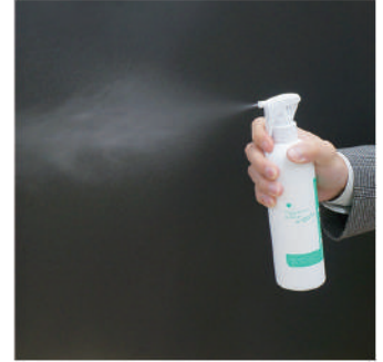
臭いの元を分解して消臭