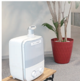
専用の噴霧器に入れて空間除菌